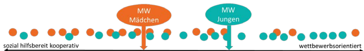
Abbildung 1. Verteilung von Verhaltensweisen.

Biologische Unterschiede zeigen sich z.B. früh in der Kindheit in unterschiedlichen Vorlieben im Spielverhalten, die teilweise gängigen Zuschreibungen von männlichen und weiblichen Verhalten (s.u. Stereotype) entsprechen, z.B. dass Mädchen eher kooperativ und sozial, Jungen dagegen wettbewerbsorientiert sind. Diese Vorlieben im Spiel aber sind nicht so ausgeprägt, dass sie die Verhaltensunterschiede in ihrer Gesamtheit erklären können. Der Überlappungsbereich zwischen Mädchen und Jungen ist sehr groß (Abbildung 1).